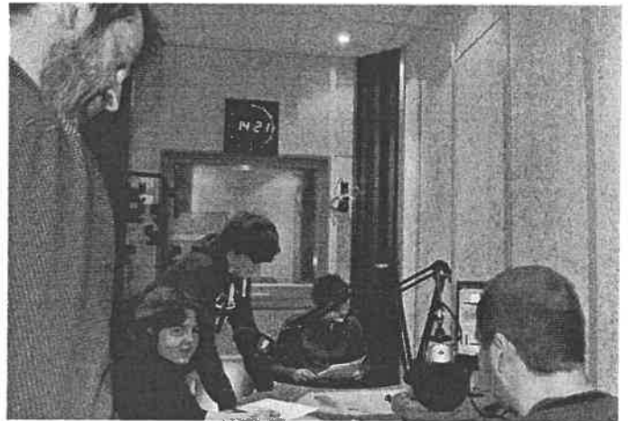
L'équipe du P'tit Rigolet dans les studios de France bleu Cotentin !