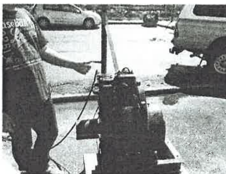
Le moteur « Lister » prêt à recevoir l'hydrogène.

En mai, les mécas ont démarré pour la première fois un nouveau moteur en vue de l'alimenter à l'hydrogène. Le premier générateur HHO par électrolyse a été essayé, nous avons pu vérifier la présence d'hydrogène dans les bulles de savon. Expérience concluantes pour nos futurs mécaniciens !