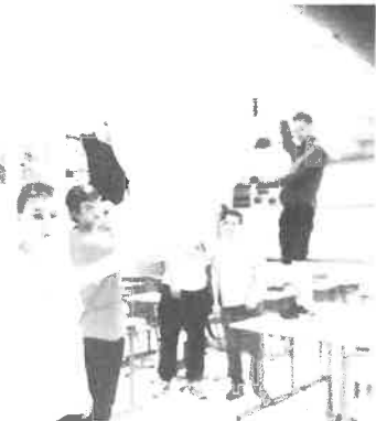
Les pêchous et leur chalut !

La classe de 2 nd e pêche fabrique la maquette du chalut de « Ma Normandie » pour voir comment cela fonctionne une fois mis à l'eau ! Nous allons le tester dans le bassin d'essais de Lorient en fin d'année. Les élèves travaillent dessus le mercredi après-midi, ils prennent des mesures, font des coupes et rassemblent les morceaux pour former le chalut.