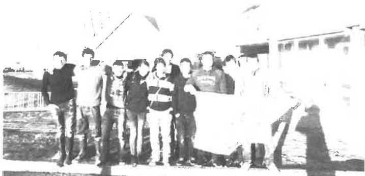
Nos voyageurs devant l'école des pêches de Grande Rivière.

« Nous autres » les premières cultures marines et Pêche avons traversé l'Atlantique à la découverte de la Gaspésie pour rechercher des nouvelles techniques de travail.